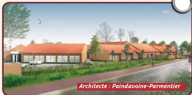
Architecte : Paindavoine-Parmentier

Le groupe Habitat du Nord participe à combler le manque en structures adaptées que ce soit pour les personnes âgées, ou personnes handicapées.