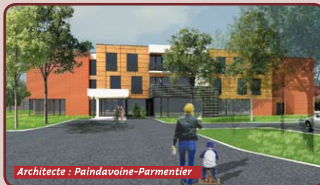
Architecte : Paindavoine-Parmentier