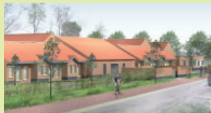
Foyer de vie - Aniche (SN Compac architecture)