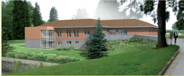
Maison d'accueil spécialisée - Felleries (agence MAES architectes urbanistes)

Qu'un spécialiste du logement social puisse répondre à des besoins ciblés comme ceux de structures pour personnes handicapées peut surprendre. Pourtant, le groupe Habitat du Nord a su développer des solutions variées en collaboration avec les associations dédiées. Foyer de vie, foyer d'accueil médicalisé, maison d'accueil spécialisée : voilà autant de projets élaborés au cas par cas pour répondre au mieux à la demande.