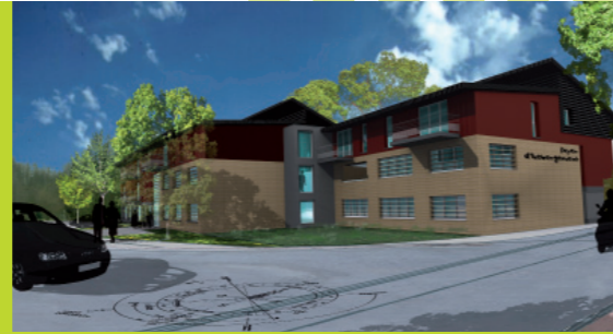
Foyer d'hébergement - Aniche (Olivier Parent architectes)