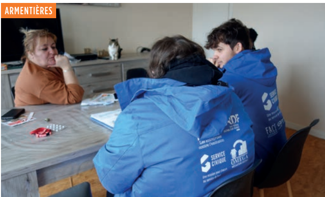
Des visites à domicile pour sensibiliser aux dangers du gaz et à ses bons usages. L'occasion aussi de rappeler quelques écogestes. Le projet CIVIGAZ est un partenariat avec GRDF et Interfaces.