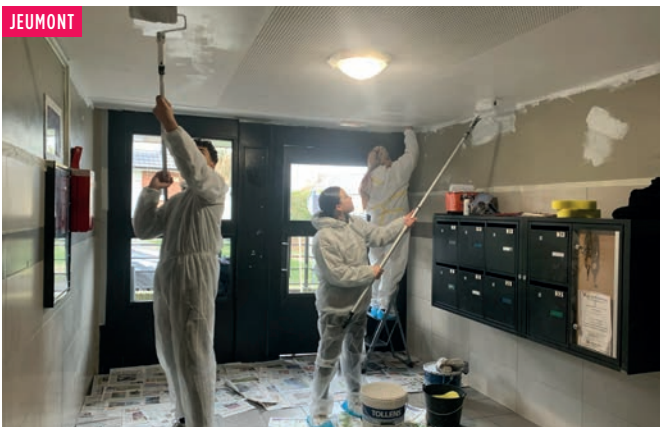
Une entrée remise en peinture par une équipe de jeunes en insertion. Porté par l'association Éducation Prévention de Jeumont et financé par Habitat du Nord, ce chantier permettra de soutenir un projet de solidarité internationale au Maroc.