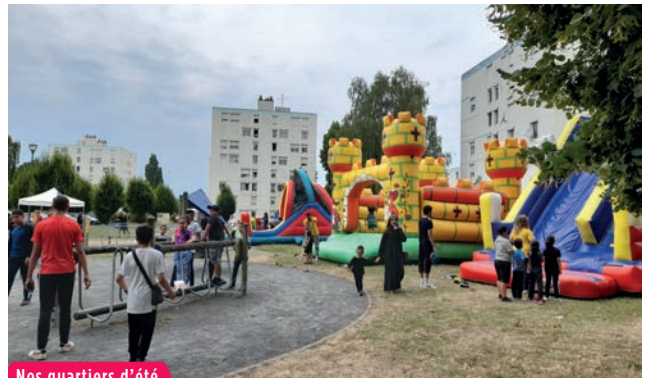
Nos quartiers d'été