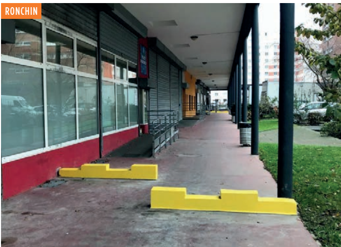
De nouveaux aménagements sous les voûtes piétonnes de La Comtesse, pour circuler plus en sécurité.