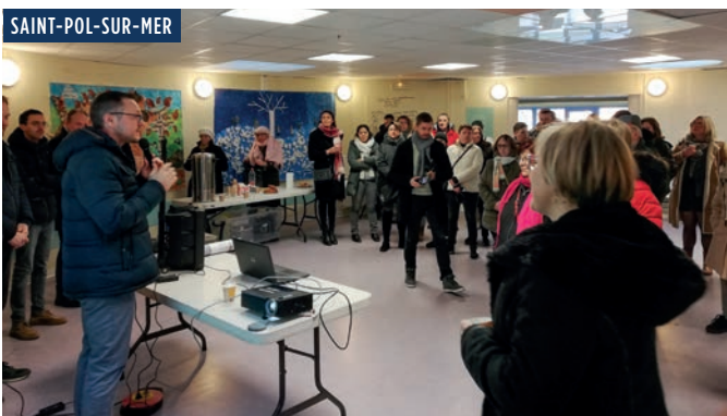
Un café-chantier pour parler des démolitions à venir sur le quartier Jean Bart – Guynemer. En présence du Maire, des entreprises et des équipes d'Habitat du Nord.