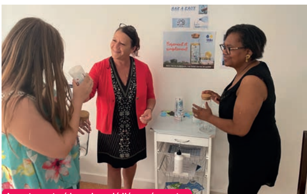
Appartement pédagogique dédié aux écogestes