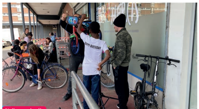
Atelier repair vélo