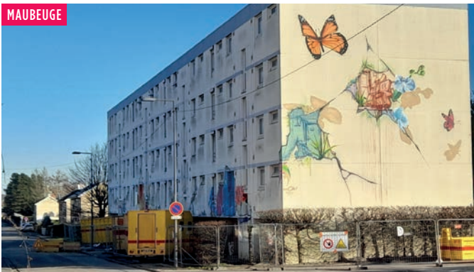
Quartier des Présidents, les travaux préparatoires aux futures démolitions (prévues cet été) ont démarré. Ici le bâtiment Fallières, en cours de curage et désamiantage.