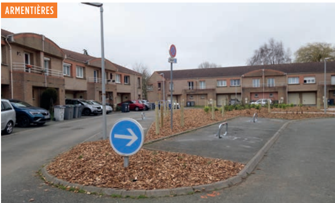
Pour répondre à une problématique de stationnement sur le quartier, et suite à une concertation avec les habitants, le "haricot" de la résidence de l'Attargette a été réaménagé avec la création de places de parking végétalisées.