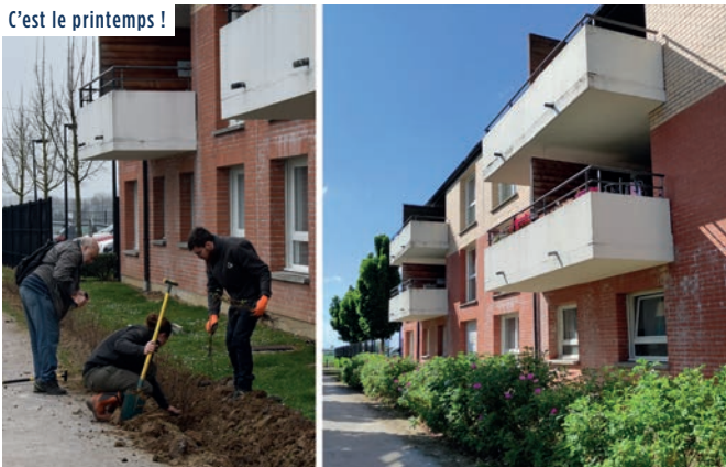
Nos jardins partagés ainsi que les aménagements de nos espaces verts reprennent ! Ici un avant-après éloquent des abords de la résidence de l'Arbrisseau à Wattignies, fruit d'une collaboration avec les habitants.

la fête des voisins vendredi 2 juin 2023